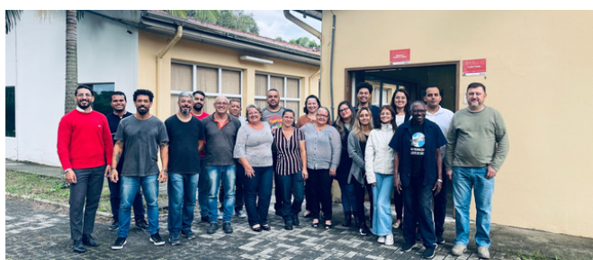
Time administrativo Fatec Pinda

Os concursos são fruto de um trabalho organizado da equipe administrativa, coordenação e direção - desde a solicitação do número de disciplinas para concurso, solicitação de novas vagas para auxiliares docentes, organização dos certames públicos até a aplicação das provas e homologação da contratação.